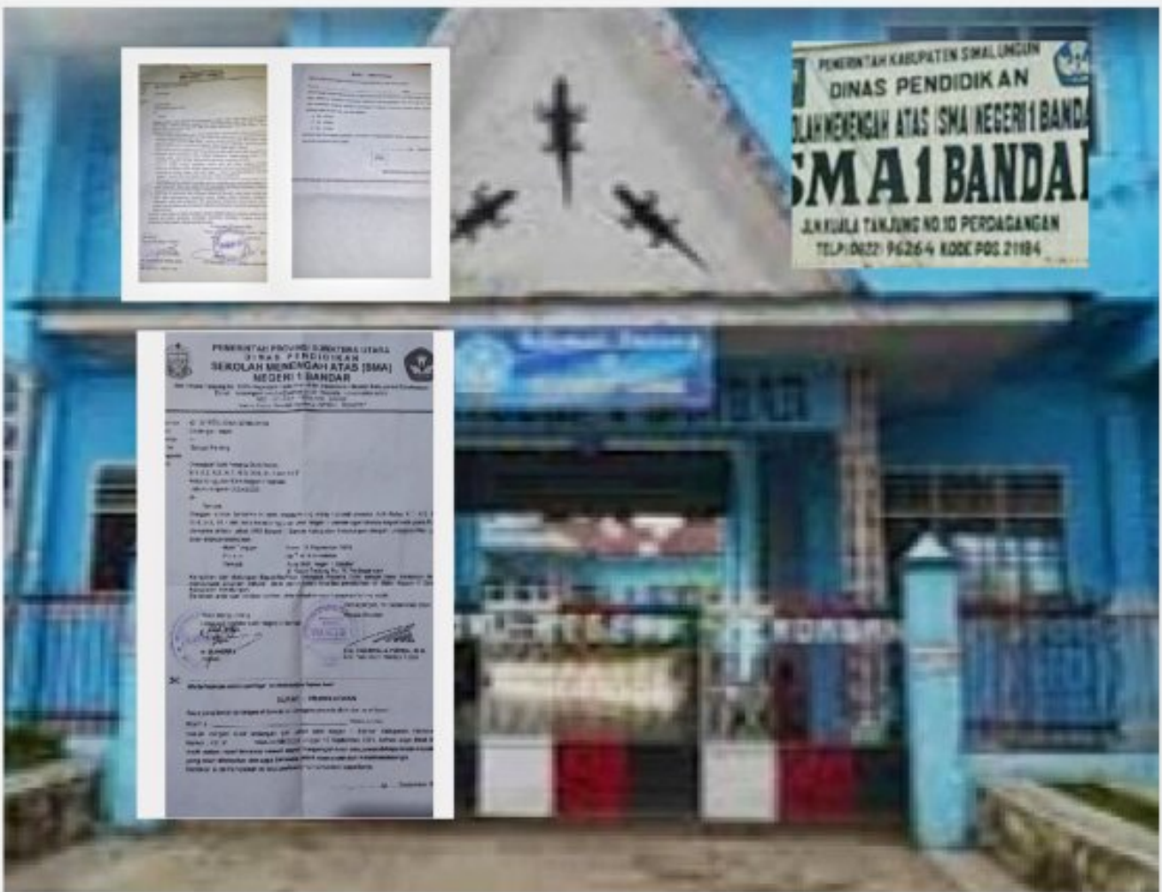
Keterangan Photo ; Istimewa

SIMALUNGUN - Kebijakan yang ditetapkan pihak penyelenggara pendidikan di SMA Negeri I Bandar menuai berbagai komentar dan tersiar kabar, soal kenaikan sumbangan dari wali siswanya dilaporkan kepada pihak Kepolisian.